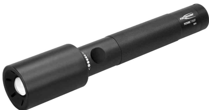
Lampe de poche LED Future T300F