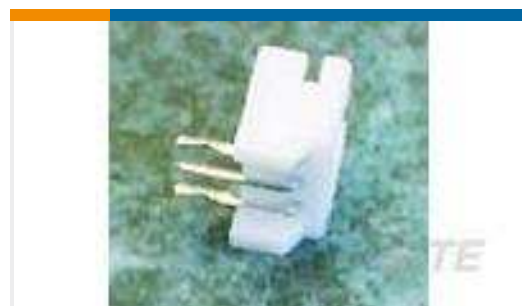
TE Teilnr.:1-440055-1 2.0MM,HDR,11POS,R/A