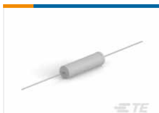
TE Teilnr.:4-2176414-8 7W STD M/OX 5% 1K8