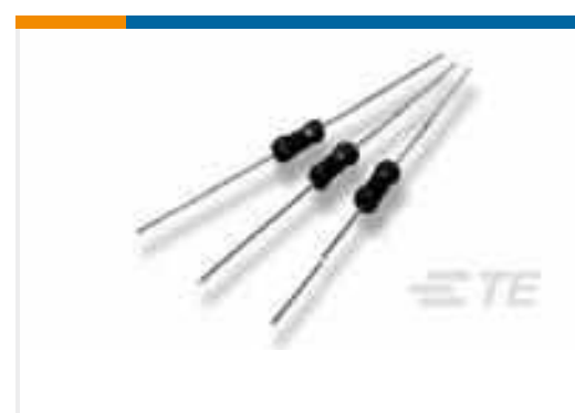
TE Teilnr.:4-1879350-2 RR01 5% 11R AMMO