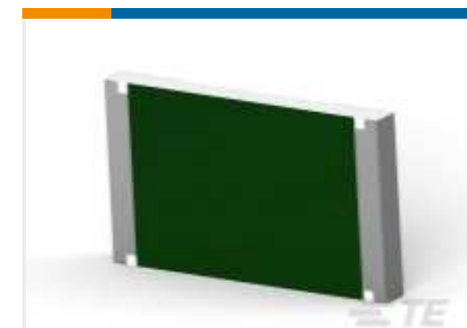
TE Teilnr.:8-2176407-8 3560 27R 5%