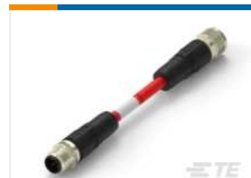
TE Teilnr.:TAA545B1411-060 M12A4-MS-FS-PVC-6.0M