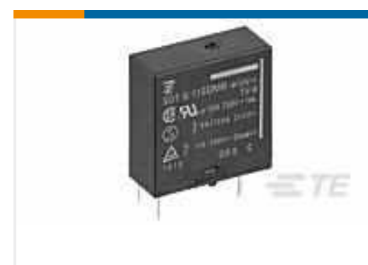
TE Teilnr.:8-1419125-5 SDT-S-106LMR,000