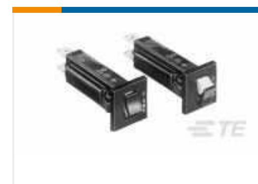
TE Teilnr.:1-1393250-7 W28-XQAT-15=W28