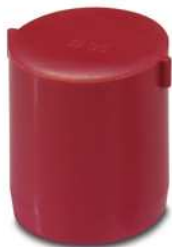
Verschlussstopfen, Material: PA, Farbe: rot

Bitte beachten Sie, dass die hier angegebenen Daten dem Online-Katalog entnommen sind. Die vollständigen Informationen und Daten entnehmen Sie bitte der Anwenderdokumentation. Es gelten die Allgemeinen Nutzungsbedingungen für Internet-Downloads. ( http://phoenixcontact.de/download )