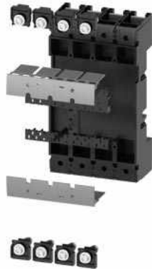
Steckeinheit Komplettbausatz Zubehör für: Leistungsschalter, 4-polig 3VA13/14; 3VA23/24