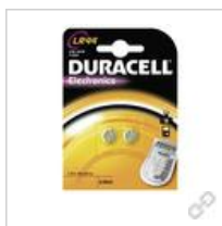
DURACELL LR44 B2 (große Karte)