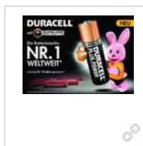
Anzeigenvorlage Duracell 'Die Batteriemarke Nr. 1 Weltweit'