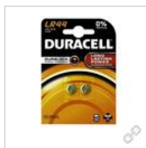
Duracell LR44 B2 (große Karte)