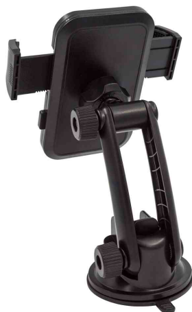
Support de fixation pour smartphone en voiture "Fix it", vue de dos