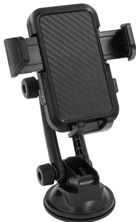
Support de fixation pour smartphone en voiture "Fix it"

- simple et rapide à installer, sur des surfaces lisses comme les pare-brise, tableaux de bord ou sur le bureau en télétravail