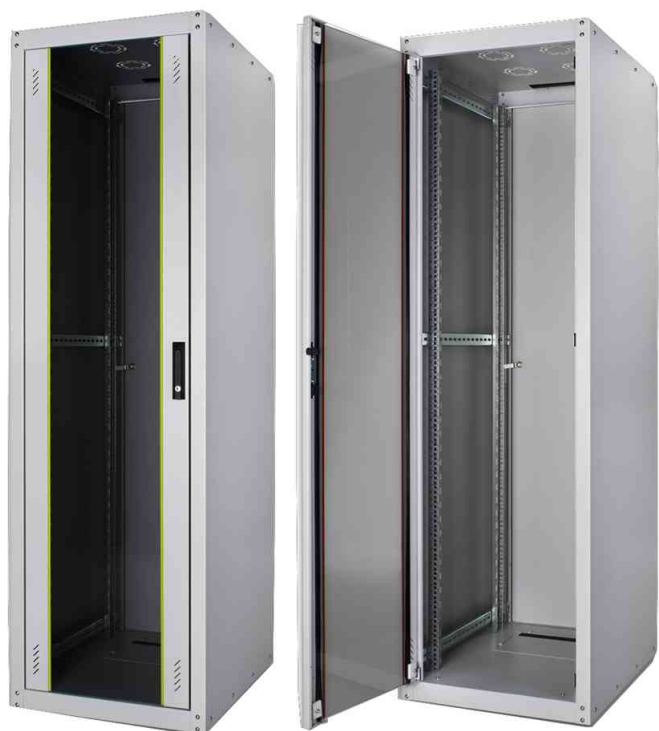
Eco-Line 19" Netzwerkschrank, Glastür

- geeignet für alle gängigen passiven EDV- und Telekommunikationsanwendungen