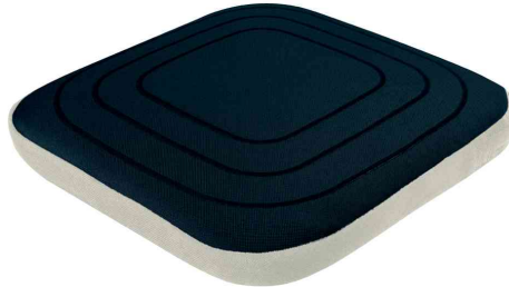
Sitzkissen Ergo Active Balance mit Stoffbezug, samtgrau