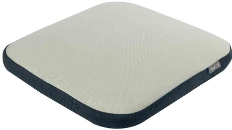
Sitzkissen Ergo Active Balance mit Stoffbezug, hellgrau