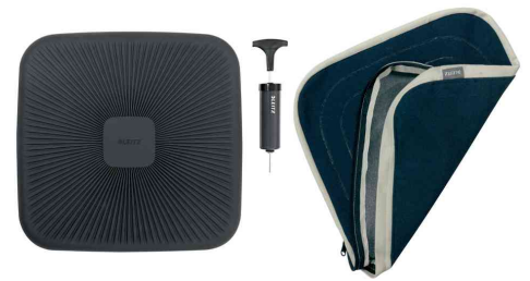
Sitzkissen Ergo Active Balance mit Stoffbezug & Luftpumpe