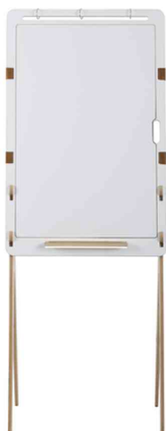
Tableau blanc de conférence "Pico"