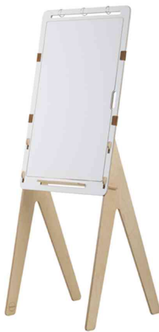
Tableau blanc de conférence "Pico", vue latérale