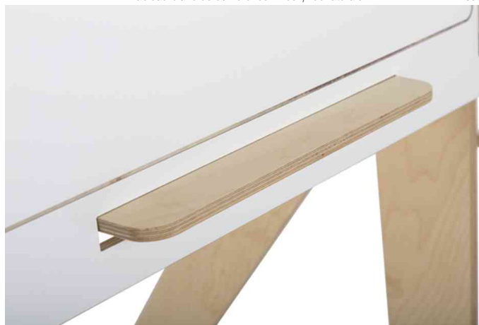
Vue détaillée : auget porte-marqueurs