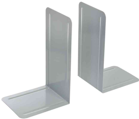
Serre-livres, (L)127 x (P)145 x (H)240 mm, gris clair