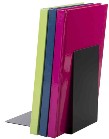
Visuel de référence : montre le produit en utilisation