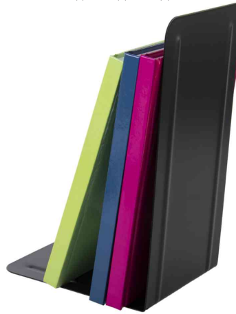
Visuel de référence : montre le produit en utilisation