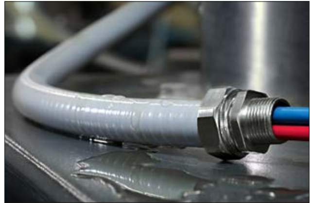
PSRSC-Schläuche sind flexibel und ermöglichen ein leichtes Einführen der Kabel sowie eine einfache Reinigung.