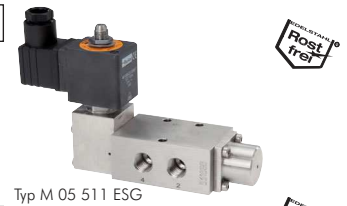
Typ M 05 511 ESG

24V= (Standard) . . . . .-24V= 230V AC (Standard) . . . . .-230V 24V AC . . . . .-24VAC 115V AV . . . . .-115V