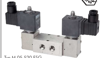
Typ M 05 520 ESG

Diese Ventile werden grundsätzlich mit Spule und Stecker ausgeliefert!