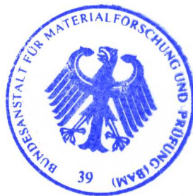
Dipl.- Ing. B.-U. Wienecke i. V. Fachbereichsleiter