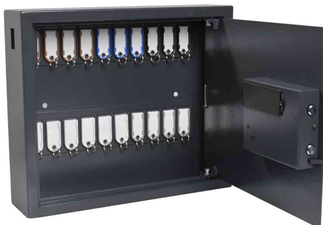
Armoire à clés Haute Sécurité pour 20 clés, ouvert