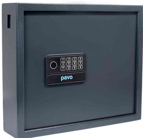
Armoire à clés Haute Sécurité pour 20 clés