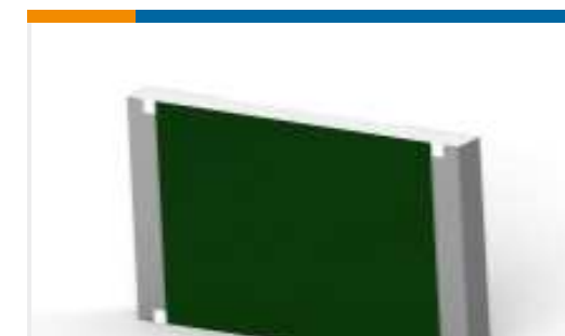
TE Teilnr.:8-2176407-8 3560 27R 5%