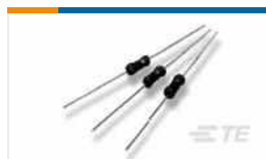
TE Teilnr.:4-1879350-2 RR01 5% 11R AMMO