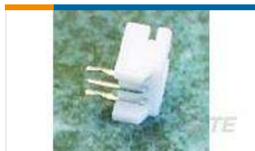
TE Teilnr.:1-440055-1 2.0MM,HDR,11POS,R/A