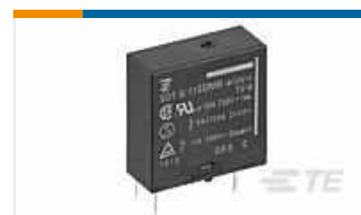
TE Teilnr.:8-1419125-5 SDT-S-106LMR,000