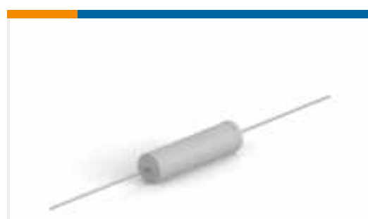
TE Teilnr.:4-2176414-8 7W STD M/OX 5% 1K8