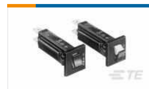
TE Teilnr.:1-1393250-7 W28-XQAT-15=W28