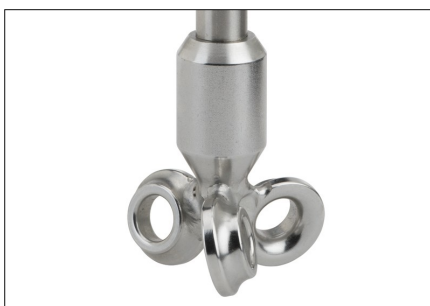
BuddeMix Mini 30/40