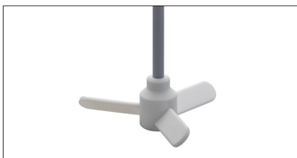
PRP2 und PRP3

Anpassung der Wellenlänge auf Wunsch möglich.