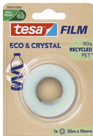
tesa Film® ECO & CRYSTAL, 19 mm x 33 m