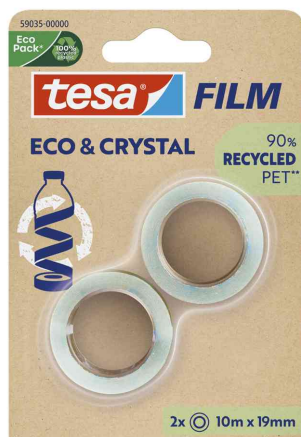
tesa Film® ECO & CRYSTAL, 19 mm x 10 m