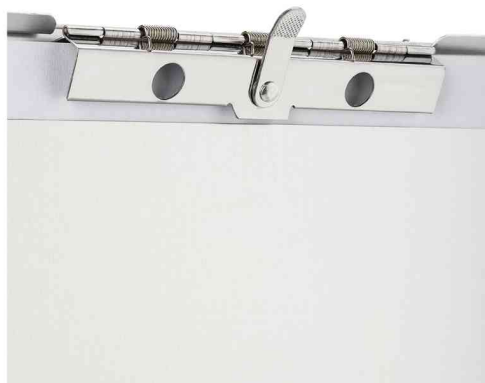
Vue détaillée: pince dentée