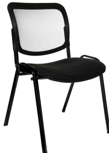
Besucherstuhl "Net Point Visit schwarz", schwarz