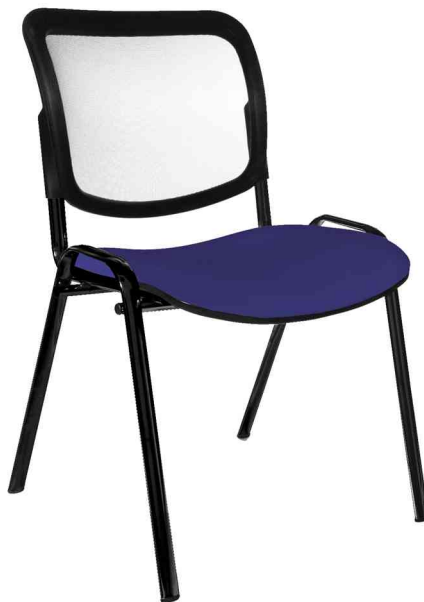
Besucherstuhl "Net Point Visit schwarz", royalblau