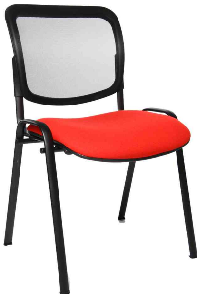
Besucherstuhl "Net Point Visit schwarz", rot