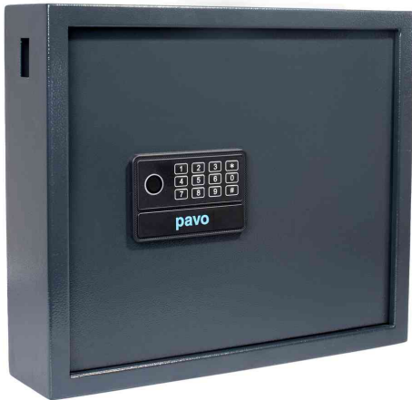
Schlüsselschrank High Security für 20 Schlüssel