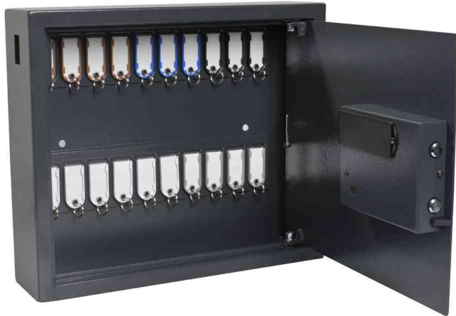
Schlüsselschrank High Security für 20 Schlüssel, offen