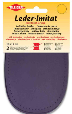
Patch imitation cuir avec doublure, violet