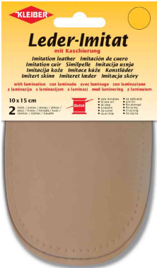
Patch imitation cuir avec doublure, beige

lavage normal à 40°C, ne pas blanchir, ne pas sécher au sèche-linge, ne pas repasser directement, ne pas laver à sec.