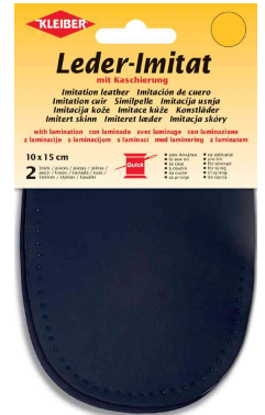
Patch imitation cuir avec doublure, marine