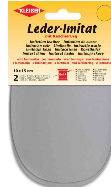
Patch imitation cuir avec doublure, gris clair