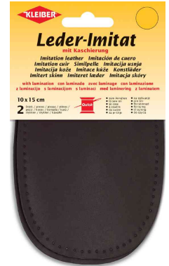
Patch imitation cuir avec doublure, brun foncé