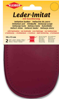
Patch imitation cuir avec doublure, bordeaux