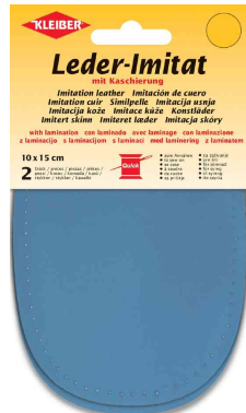
Patch imitation cuir avec doublure, bleu