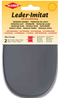
Patch imitation cuir avec doublure, gris foncé