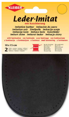
Patch imitation cuir avec doublure, noir