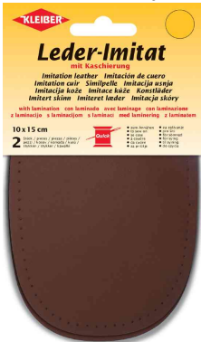
Patch imitation cuir avec doublure, brun moyen