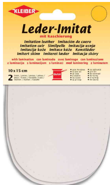
Patch imitation cuir avec doublure, blanc