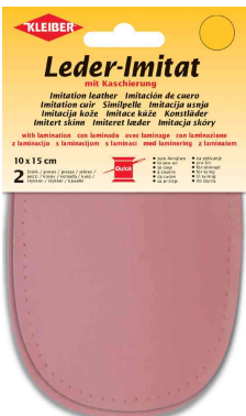
Patch imitation cuir avec doublure, rose