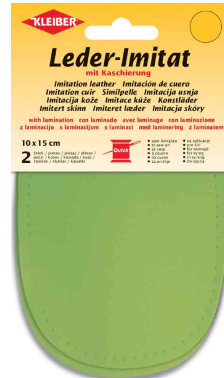
Patch imitation cuir avec doublure, citron vert