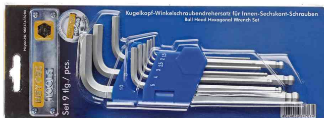
Visuel de référence: dans un emballage sous blister