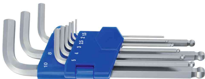
Kit de clés à six pans avec tête sphérique, 9 pièces