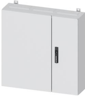
ALPHA 400 DIN UP-Wandverteiler Unterputz, IP31, Schutzklasse 1, H=800mm, B=800mm, T=210mm RAL 9016