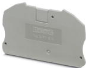
Abschlussdeckel, Länge: 75,4 mm, Breite: 2,2 mm, Höhe: 45,6 mm, Farbe: grau

Bitte beachten Sie, dass die hier angegebenen Daten dem Online-Katalog entnommen sind. Die vollständigen Informationen und Daten entnehmen Sie bitte der Anwenderdokumentation. Es gelten die Allgemeinen Nutzungsbedingungen für Internet-Downloads. ( http://phoenixcontact.de/download )