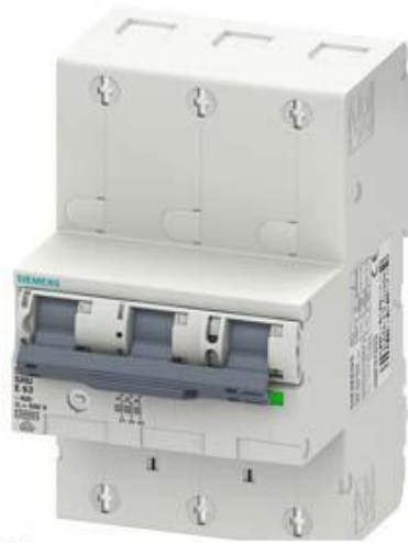
HAUPTLEITUNGSSCHUTZSCHALTER (SHU), 3POLIG, E 63, 400V