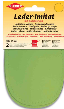
Patch imitation cuir avec doublure, citron vert