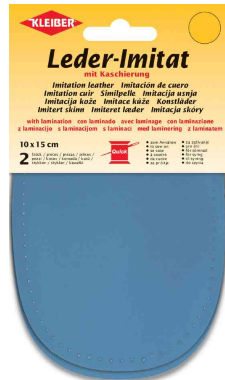
Patch imitation cuir avec doublure, bleu