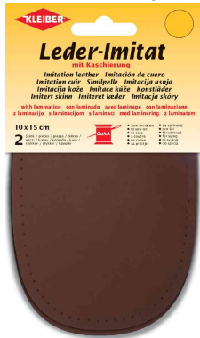
Patch imitation cuir avec doublure, brun moyen