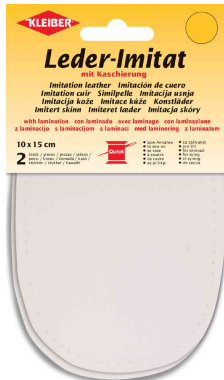
Patch imitation cuir avec doublure, blanc