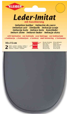
Patch imitation cuir avec doublure, gris foncé