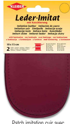
Patch imitation cuir avec doublure, bordeaux