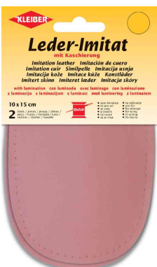
Patch imitation cuir avec doublure, rose