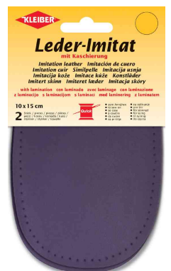
Patch imitation cuir avec doublure, violet