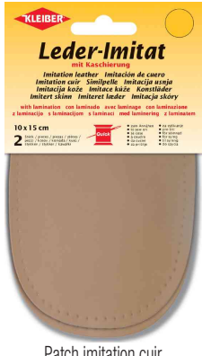
Patch imitation cuir avec doublure, beige

lavage normal à 40°C, ne pas blanchir, ne pas sécher au sèche-linge, ne pas repasser directement, ne pas laver à sec.