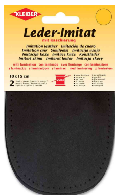
Patch imitation cuir avec doublure, noir