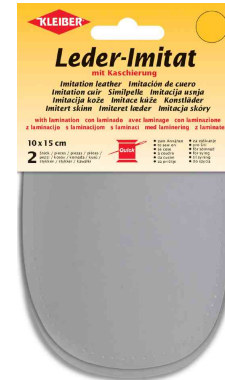
Patch imitation cuir avec doublure, gris clair