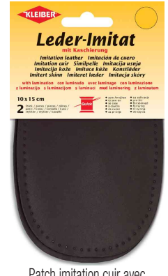
Patch imitation cuir avec doublure, brun foncé