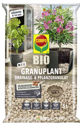
BIO GRANUPLANT Drainage- und Pflanzgranulat