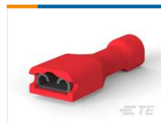
TE Teilenummer 2-520182-2 ULTRAFAST 187 ASSY REC 22-18 TPBR LP