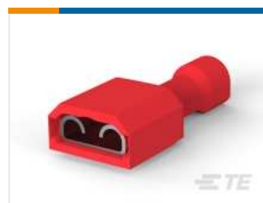
TE Teilenummer 2-520184-4 ULTRAFAST 250 ASSY REC 22-18 TPBR LP