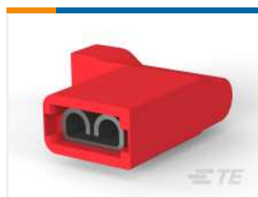
TE Teilenummer 2-520335-2 ULTRA-FAST 187 ASY REC 22-18 TPBR