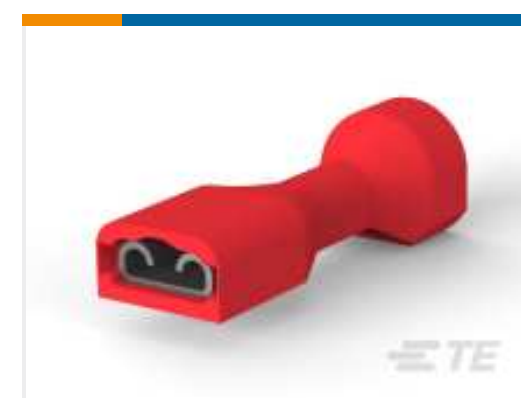
TE Teilenummer 2-520275-2 ULTRAFAST 187 ASSY REC 22-18 TPBR LP