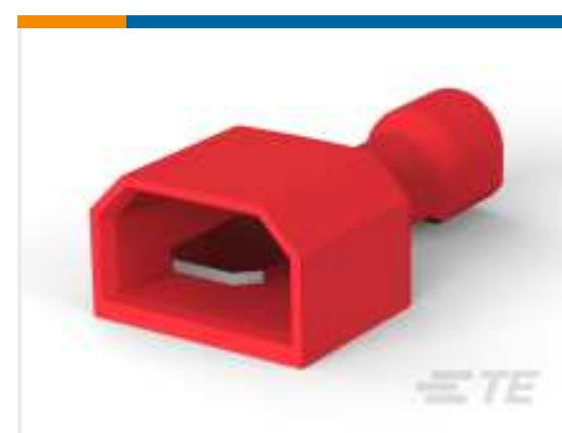
TE Teilenummer 2-521105-2 ULTRA-FAST 187 ASY REC 22-18 TPBR