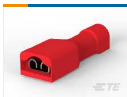
TE Teilenummer 2-520084-2 ULTRAFAST 110 ASSY REC 22-18 TPBR LP