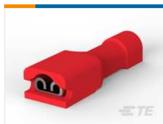
TE Teilenummer 2-520081-2 ULTRAFAST 110 ASSY REC 22-18 TPBR LP