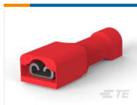
TE Teilenummer 2-520273-2 ULTRAFAST 110 ASSY REC 22-18 TPBR LP