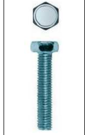
Imagen de producto/ Product picture