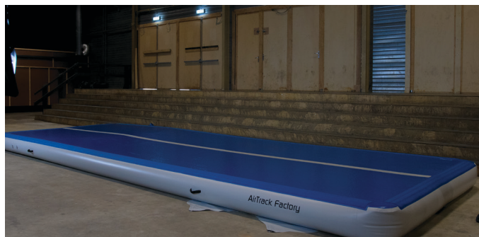
Stellen Sie sicher, dass die D-Ringe an der Befestigungsplane nach unten zeigen