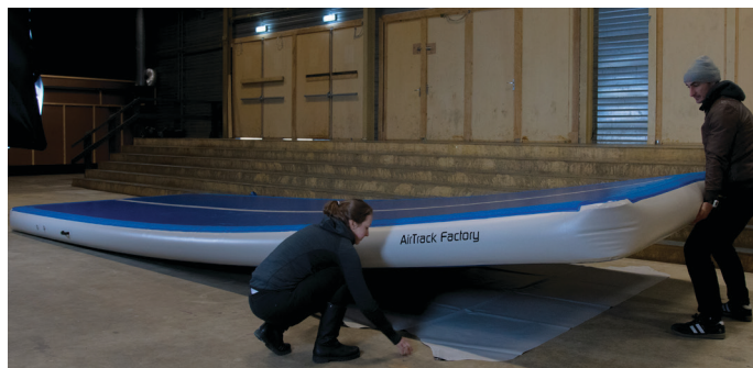
Platzieren Sie die Befestigungsplane unter Ihrem Airtrack