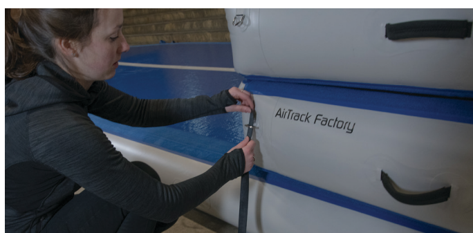
Beachten Sie, dass der Gurt durch den D-Ring jeder Airbox gezogen werden muss