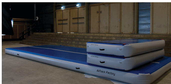
Wiederholen Sie diesen Vorgang auf beiden Seiten pro Airbox