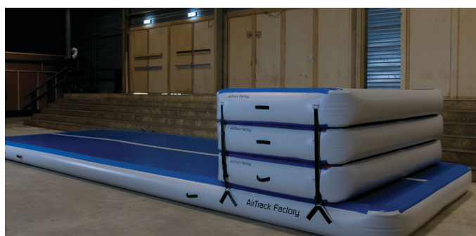
Viel Spaß beim trainieren