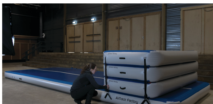
Stellen Sie sicher, dass die Airbox komplett gesichert und festgezogen ist