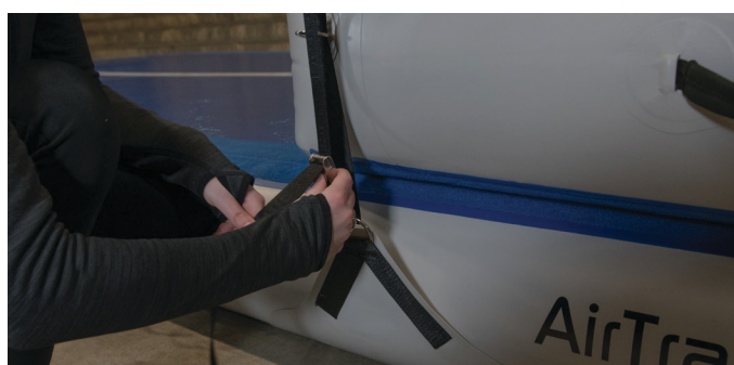
Ziehen Sie den Gurt an dem losen Ende fest