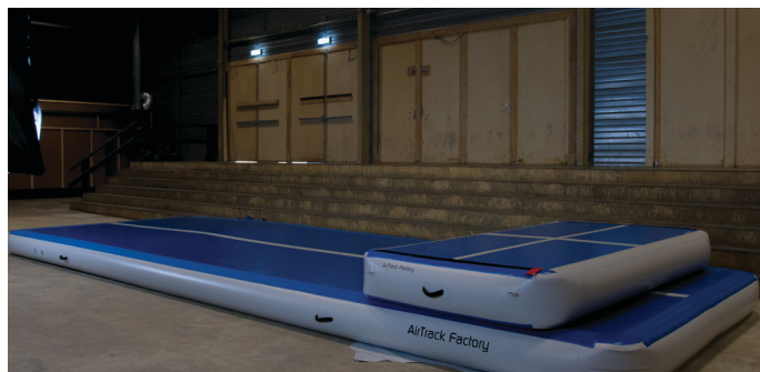
Stapeln Sie die Airbox-Teile auf der Befestigungsplane