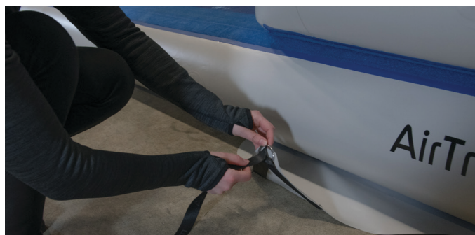
Fädeln Sie den Befestigungsgurt durch den D-Ring