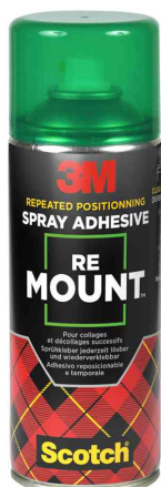
Colle spray RE MOUNT