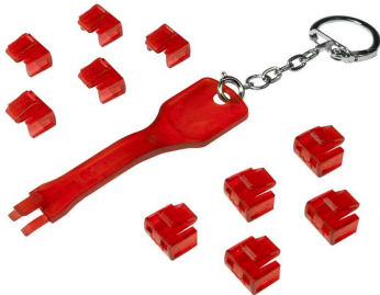
RJ45 Sicherheitsschloss, 1 Schlüssel / 10 Schlösser