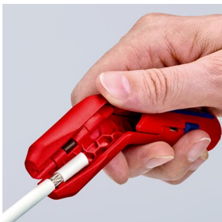
Usuwanie izolacji z kabli koncentrycznych