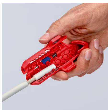
do usuwania izolacji z przewodów NIM