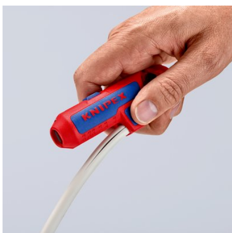
Ostrze wewnętrzne w bocznej powierzchni podparcia dla kciuka zapewnia komfortowe cięcie wzdłużne