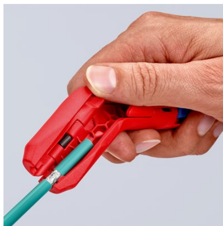
Usuwanie izolacji z przewodu teleinformatycznego