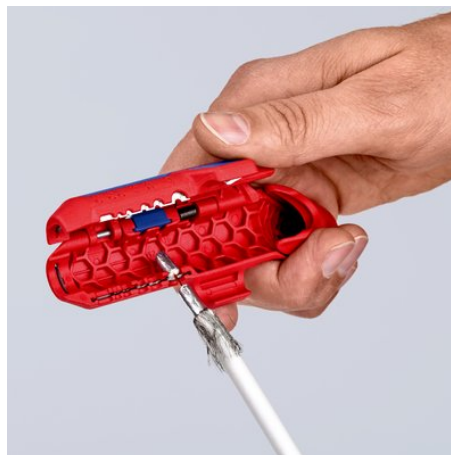
Usuwanie izolacji z kabli koncentrycznych