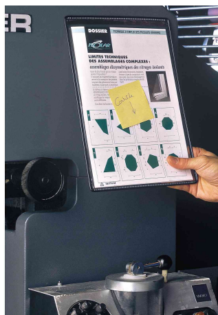
Visuel de référence: présente le produit en utilisation