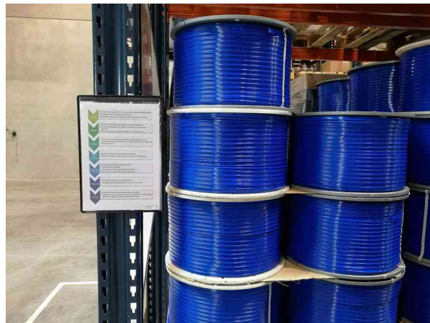
Visuel de référence: présente le produit en utilisation