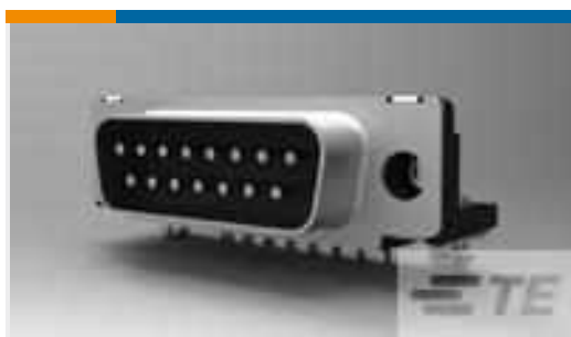
TE Teilnr.:5747841-3 15 MSFL PLUG RA 318 (IN,FM,BL)