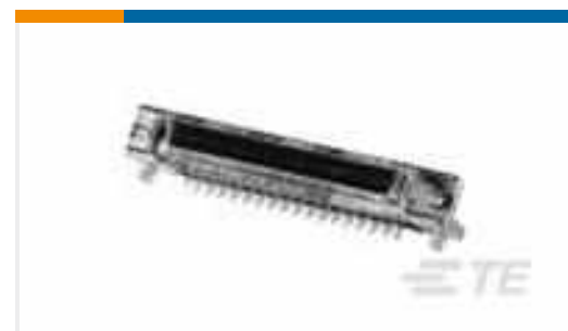
TE Teilnr.:1761028-3 50 50SR R/A RCPT ASSY,LEAD FRE