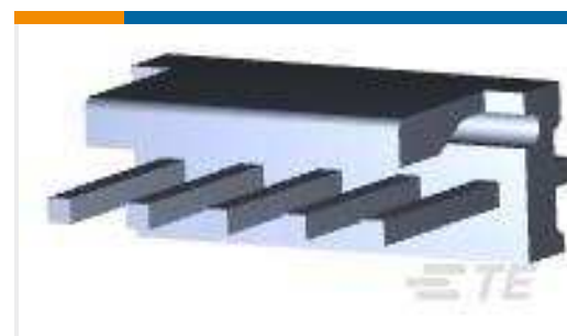
TE Teilnr.:640445-5 05P MTA156 HDR ASSY FL/STR SN