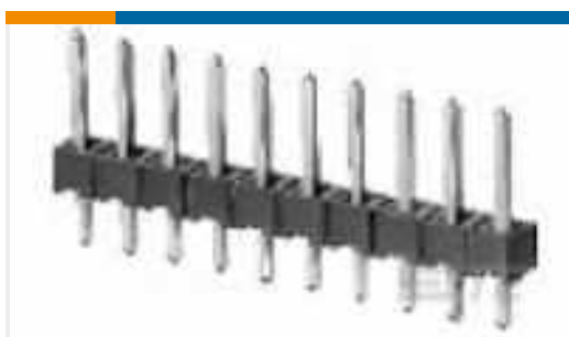
TE Teilnr.:5-146282-2 02 MODII HDR SRST B/A .100CL