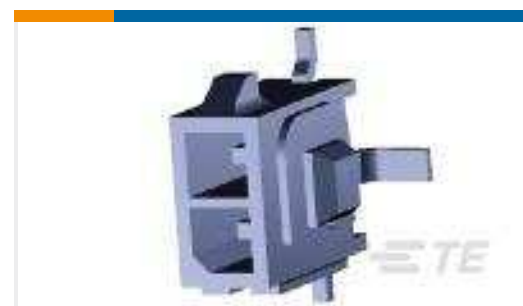
TE Teilnr.:3-794636-2 02P MICRO MNL ASSY,VRT,SMT,LF