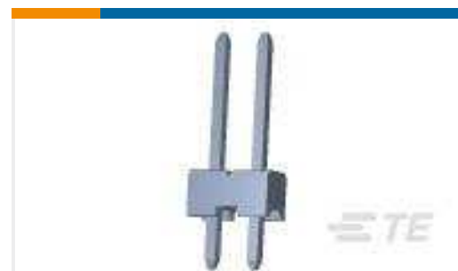
TE Teilnr.:3-644456-2 02P MTA100 HDR ASSY (NARROW)