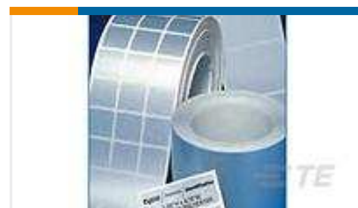
TE Teilnr.:A57045-000 WP-165051-25-9