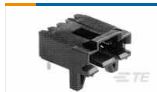
TE Teilnr.:5-103673-3 4 MTE HDR SRRA LATCH W/HLDWN