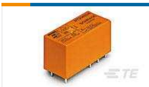
TE Teilnr.:9-1393239-5 RT314012