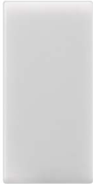
DELTA m-system Lichtsignal 1-fach Lichtfarbe weiß 1W 90-240V