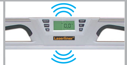
AutoSound bei 0°/45°/90°/135°/180°