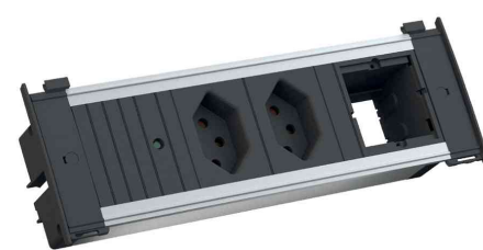
Steckdoseneinheit KAPSA S, 2-fach, T13-Steckdosen