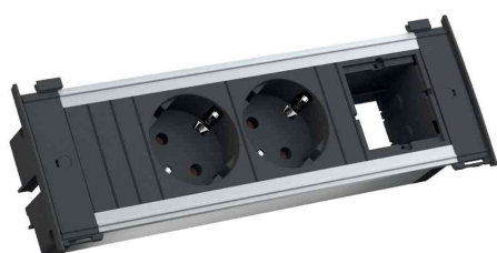
Steckdoseneinheit KAPSA S, 2-fach, Schutzkontakt-Steckdosen