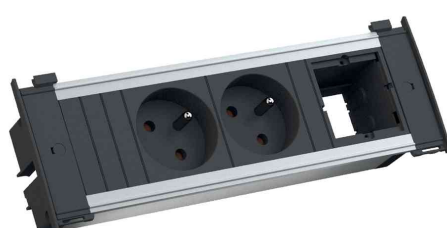
Steckdoseneinheit KAPSA S, 2-fach, UTE-Steckdosen