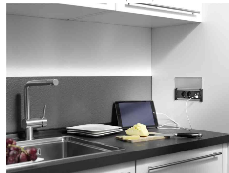
zeigt das Produkt in der Anwendung