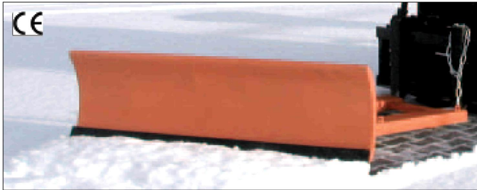
Typ SCH-G mit Gummischürfleiste