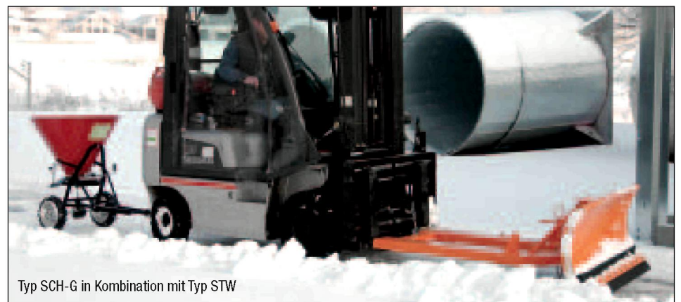
Typ SCH-G in Kombination mit Typ STW