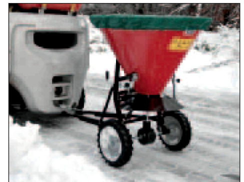
Typ STW mit Abdeckplane