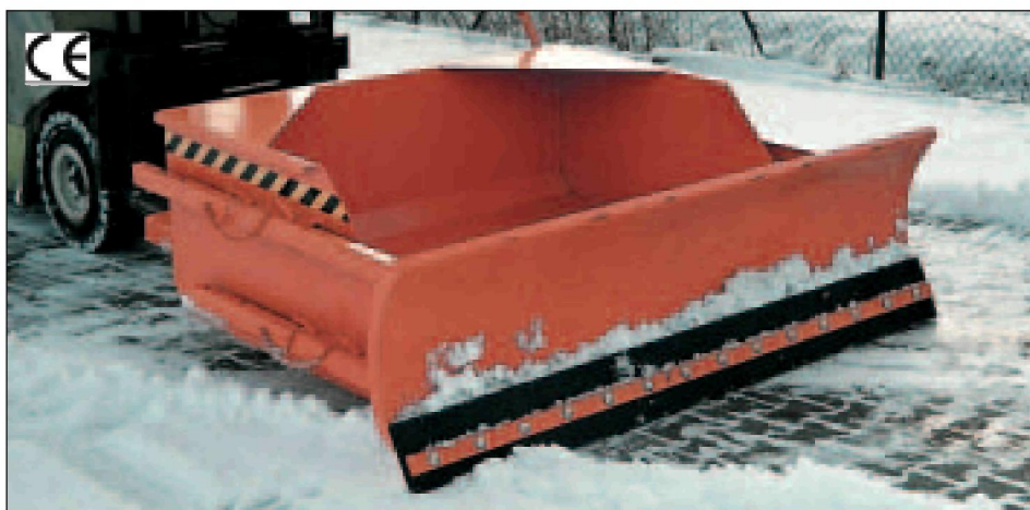
Typ SRS-G mit Gummischürfleiste