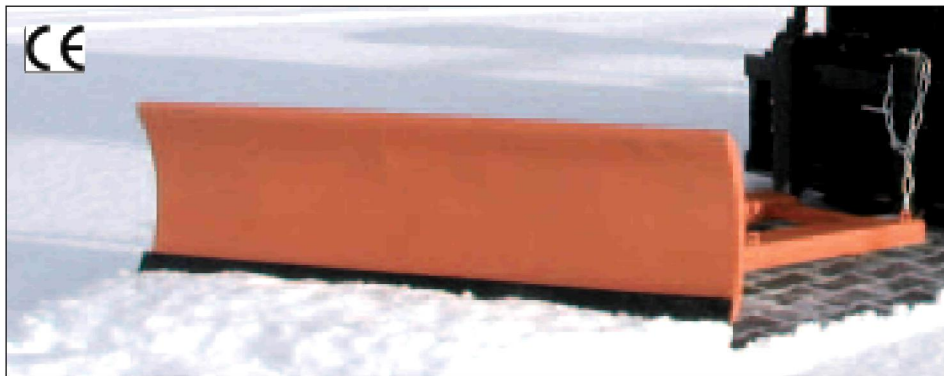
Typ SCH-G mit Gummischürfleiste