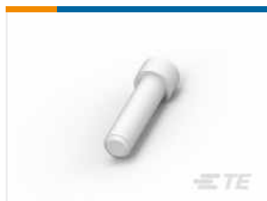
TE Teilnr.:114017-ZZ SEALING PLUG, SIZE 12/16, WHT