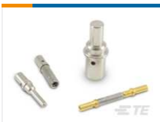
TE Teilnr.:0460-202-16141 MASSIVE DEUTSCH KONTAKTE