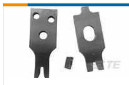
TE Teilenummer7-2150055-7 OCEAN_2.0 SPARE_PART_KIT-100F210F