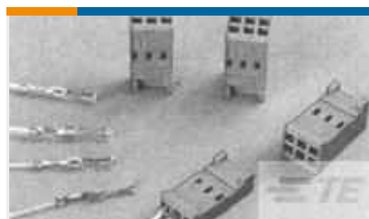
TE Teilenummer 188744-1 CONTACT REC HE14 COSI TIN PLATED