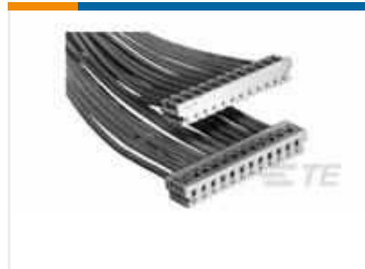
TE Teilenummer7-179228-4 CT CRIMP-2 REC HSG 14P BLACK