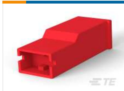
TE Teilenummer2-154719-0 PL 250 REC HSG 1P NYLON RED