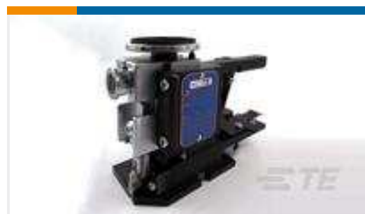
TE Teilenummer2-2150234-1 OCEAN_2.0 APPLICATOR-E-110F180F