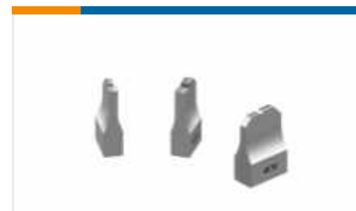
TE Teilenummer3-1803001-4 ANVIL, COMBINATION, END FEED