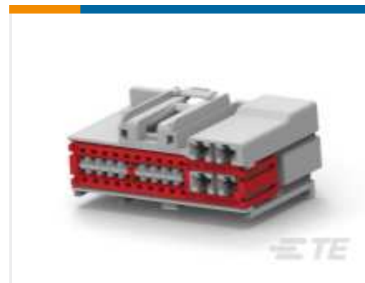
TE Teilenummer1-2236269-2 24POS, MIXED, REC HSG, 20GENYMCP, ASSY, CODB