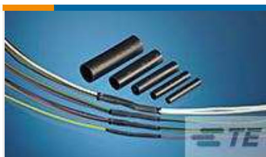
TE TeilenummerCH03556001 QSZH-125-NR3-27MM