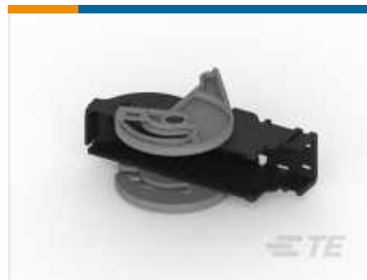
TE Teilenummer1-2209521-1 46POS. COVER ASSY