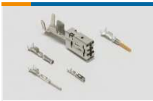
Kontakte für Pkw, Lkw, Busse und Off-Road-Fahrzeuge(113)