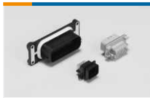
Stiftwannen für Pkw, Lkw, Busse und Off-Road-Fahrzeuge(5)