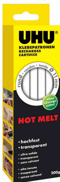
Accessoire - Recharge de bâtons de colle pour coller à chaud Hot Melt, 200 g