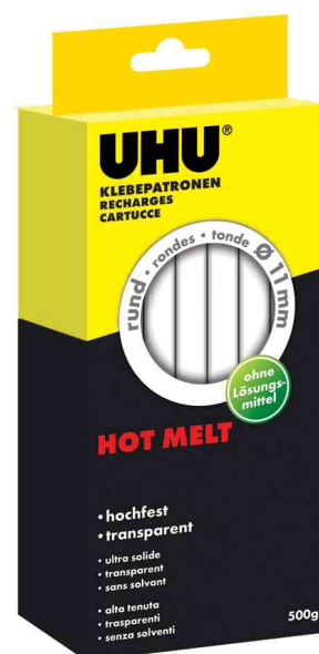
Accessoire - Recharge de bâtons de colle pour coller à chaud Hot Melt, 500 g