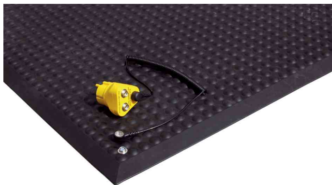
Arbeitsplatzmatte Yoga Ergo Fusion