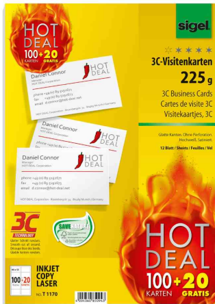
Cartes de visite 3C

Code 8202684 "HOT DEAL": contenu = 100 cartes de visite + 20 cartes de visite gratuites!