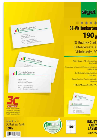
Visuel de référence: Cartes de visite 3C