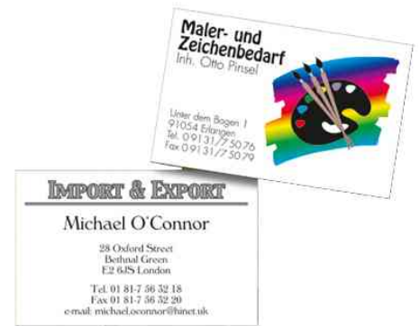
Cartes de visite 3C, exemple d'utilisation