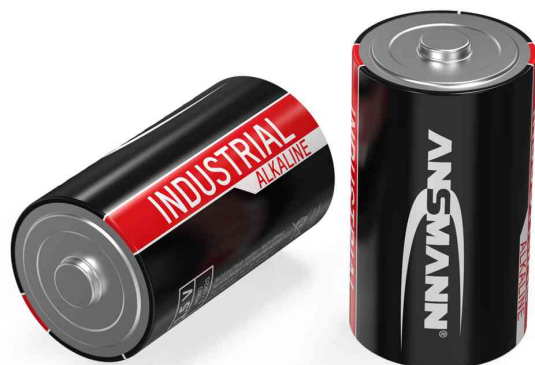
Pile alcaline "Industrial" Mono D

- convient aux applications dans l'industrie, pour les gros consommateurs, la technique médicale et la technique événementielle