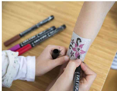
Visuel de référence: exemple d'utilisation