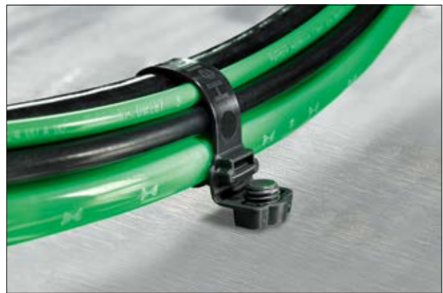
Wide Strap Befestigungsbinder mit Schweißbolzenaufnahme für Anwendungen in Schwerlastbereichen.