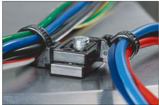
T50SOSWSPE-2, parallele Montage verschiedener Kabelsätze an einem Schweißbolzen mit 2 Befestigungsbindern.