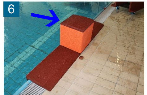
6 Randplatte passgenau auf EPDM-Würfel auflegen, Fläche Seite zum Wasser