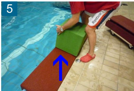
5 EPDM-Würfel passgenau und mittig auflegen