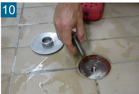
10 Schutzschraube entfernen