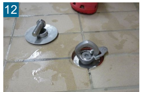
12 Halteschraube bis Anschlag - nur Handkraft - Inbus lösen -

Die vorgenannten Aufbausritte sind auch auf der gegenüberliegenden Seite durchzuführen