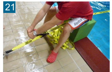
21 Slackline spannen Handkraft, ohne Hilfsmittel! Wichtig - Ratsche sichern!