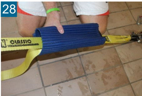
28 Ratschenschutz um Ratsche legen