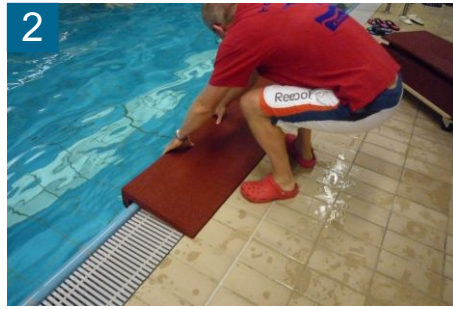
2 rechten Winkelschutz am Beckenrand ablegen