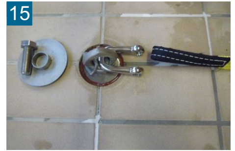
15 Gleiche Verbindung gegenüber herstellen