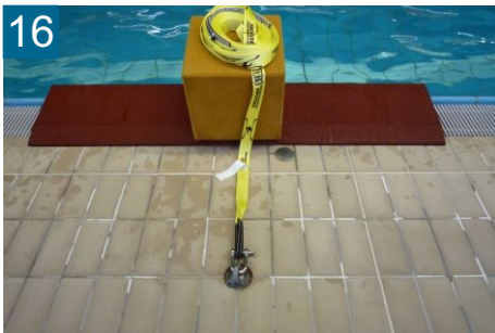
16 verbundene Seite Linebereich