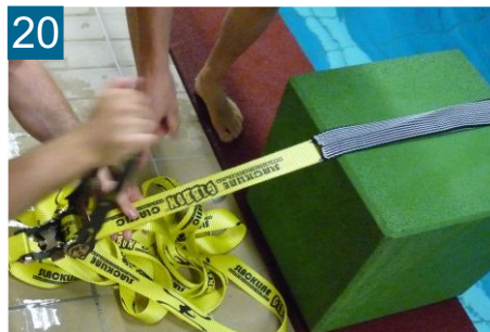
20 Slackline durch Zug vorspannen und ca. 3 mal ratschen bis Line greift