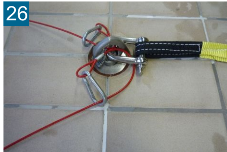
26 Sicherungsseil gegenüber an Schäkel befestigen