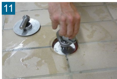
11 Inbus einstecken Halteschraube eindrehen