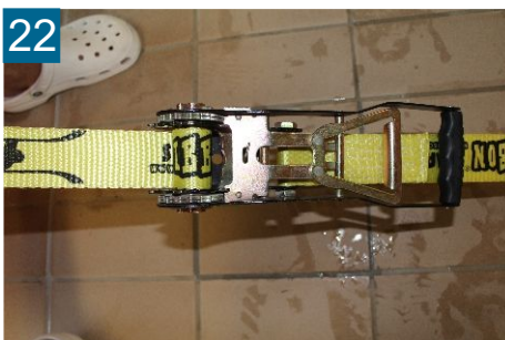
22 Gesicherte Ratsche