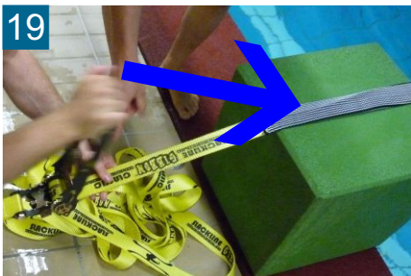
19 Auf gleichmäßige Ausrichtung des Abriebschutzes achten