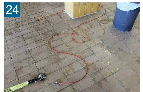
24 Sicherungsseil um Halterung legen