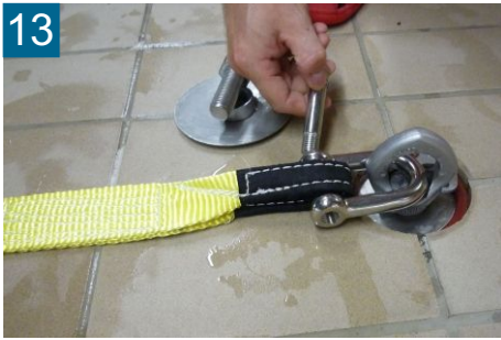
13 Halteschraube und Slackline mit Schäkel verbinden