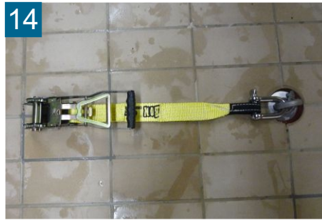
14 verbundene Seite Spannungsbereich