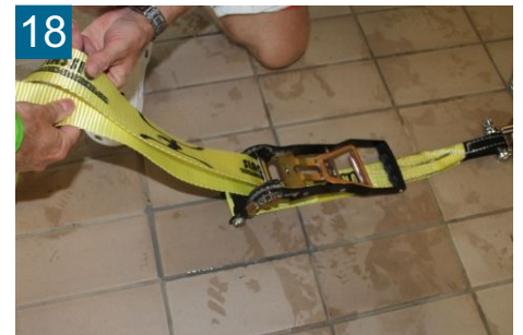
18 Slackline mit Ratsche verbinden