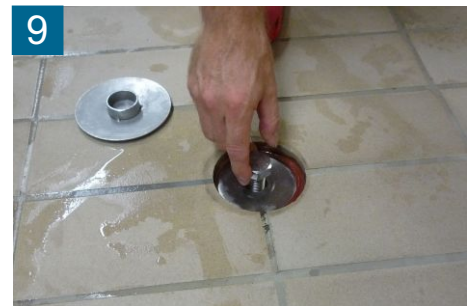
9 Schutzschraube herausdrehen