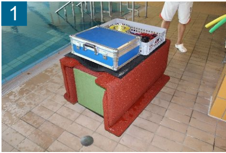
1 Rollwagen mit Fallschutz, Halterung und Sicherung