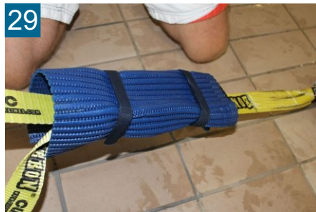
29 Ratschenschutz mit Klettverschluß befestigen