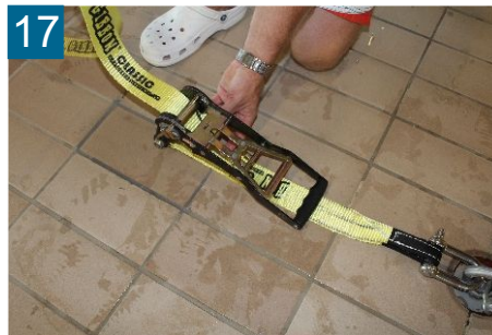
17 Slackline mit Ratsche verbinden