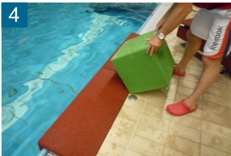
4 EPDM-Würfel passgenau und mittig auflegen