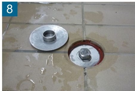
8 Abdeckung entfernen