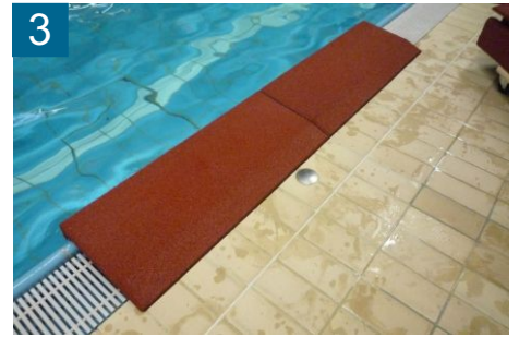
3 linken Winkelschutz am Beckenrand ablegen